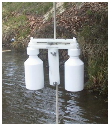
Figure 2 : Bouteille à prélèvement Merkos (Hydro-bios, Allemagne).