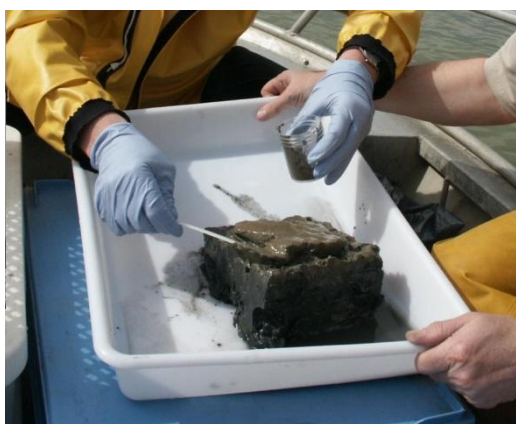
Figure 4 : Prélèvement du premier centimètre superficiel d'une carotte obtenue à l'aide d'une benne de type Ekman sur embarcation légère.

Le port des gants en nitrile (non poudré) est obligatoire lors des opérations de manipulation des échantillons. Ne pas manipuler la benne ou le carottier avec les gants qui serviront à manipuler le flaconnage. Les gants doivent être changés pour chaque prélèvement.