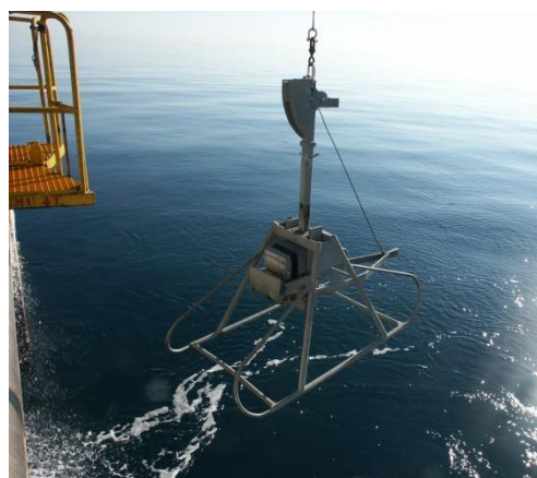
Figure 5 : Mise à l'eau d'un carottier-boîte de type Micro-Reineck sur navire hauturier.