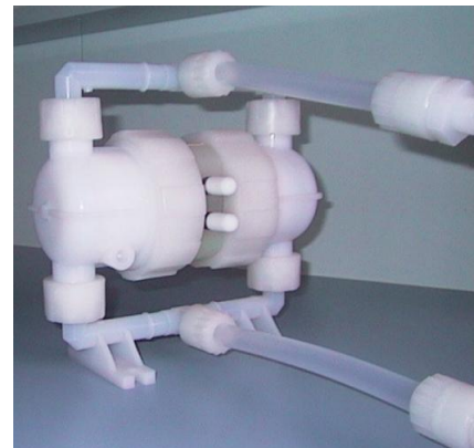
Figure 3 : Pompe à piston en téflon (Asti, France).