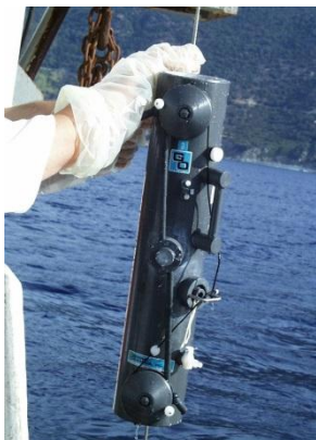
Figure 1 : Bouteille à prélèvement Go-Flo (General Oceanics, USA).

Toutes les manipulations ont lieu avec des gants nitrile (non poudré). La bouteille à prélèvement et le messenger sont conservés dans des sacs de polyéthylène jusqu'au prélèvement. Sortir la bouteille de son sac pour la fixer au câble. Sortir le messenger de son sac, le fixer sur le câble. Eloigner ensuite le câble de la coque du bateau en retenant le messenger, puis filer le câble jusqu'à la profondeur désirée, et envoyer le messenger. Remonter alors la bouteille, désormais fermée. Décrocher la bouteille, récupérer le messenger et le conserver dans son sac jusqu'au prélèvement suivant. De la bouteille à prélèvement, soutirer l'eau, chaque flacon doit être rincé au moins trois fois avec l'eau prélevée, avant d'être complété pour constituer l'échantillon d'eau qui sera transmis pour analyse. Remettre la bouteille dans son sac en polyéthylène.